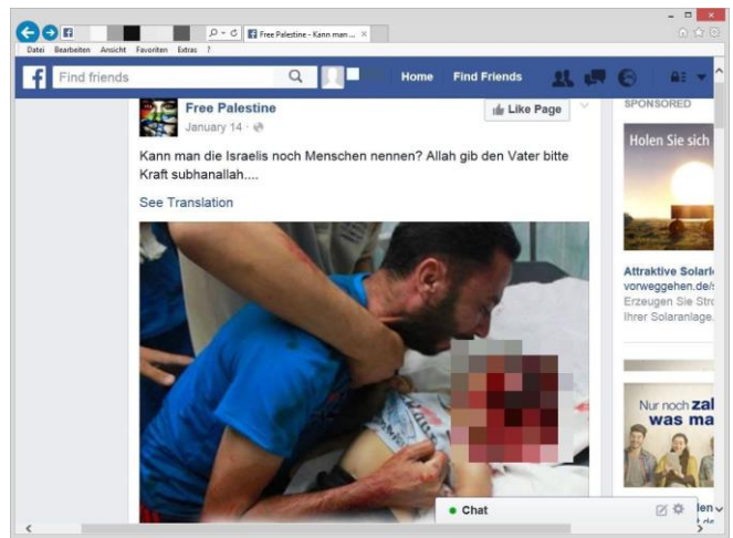
Drastische Darstellungen toter Kinder sollen Hass schüren.

Zu Volksverhetzungen kommt es hauptsächlich in den Kommentarbereichen. Dort wünschen User immer wieder Israel oder allen Juden die Vernichtung. Beispielsweise wird Bedauern darüber geäußert, dass Hitler nicht zu Ende gebracht habe, was er begann. Entsprechende Beiträge werden nicht immer zeitnah von den Plattformbetreibern entfernt.