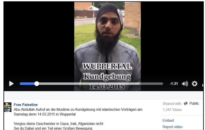
Auf dem Profil "Free Palestine" wird für eine salafistische Veranstaltung geworben.

Zu finden sind auch Profile, auf denen die Kämpfer der terroristischen Hamas als Helden glorifiziert, terroristische Taten gegen israelische Zivilisten als Selbstverteidigung erklärt oder gänzlich negiert werden. Propagiert werden auch die Ziele der Hamas: Die Vernichtung Israels und die Gründung eines islamischen Staates.