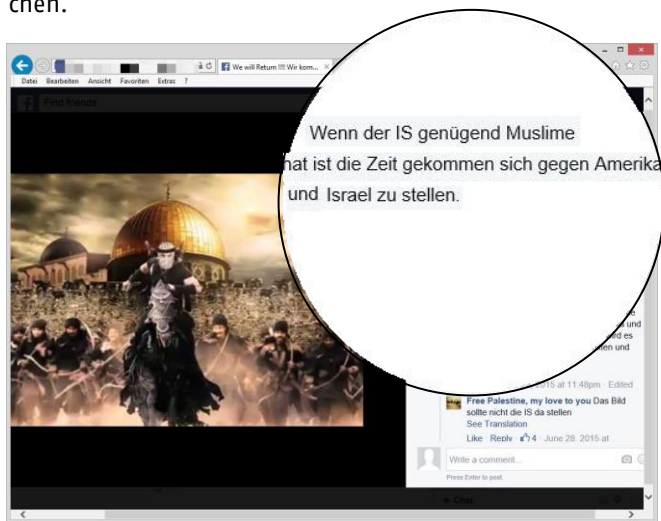
User-Kommentar bewirbt die terroristische Organisation "Islamischer Staat".

Immer wieder schalten sich auch User ein, die explizit islamistisches, teilweise sogar dschihadistisches Gedankengut verbreiten und die Stimmung gezielt anheizen. Anfängliche "Zurückhaltung" schlägt dann schnell in unverhohlenen Judenhass um und schafft ein Klima, in dem volksverhetzende Aussagen veröffentlicht werden – auch von Jugendlichen.